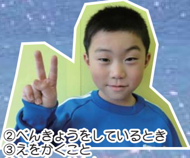
②ペンぎょうをしているとき ③えをかぐこと ④サッカーせんしゅ