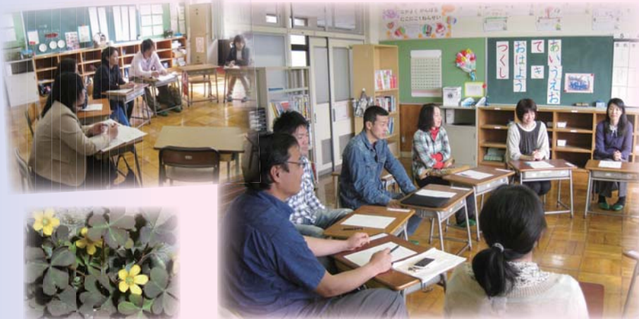
学級懇談会の風景