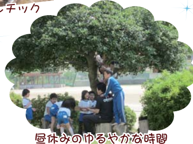
昼休みのゆるやかな時間