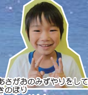
②あさがおのみずやりをしているとき ③きのほり ④サッカーせんしゅ