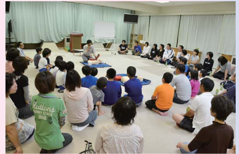
命を守るために真剣に学ぶ