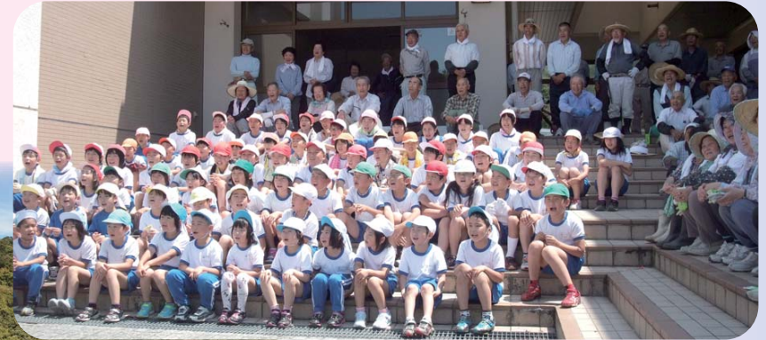
世代間交流草取り