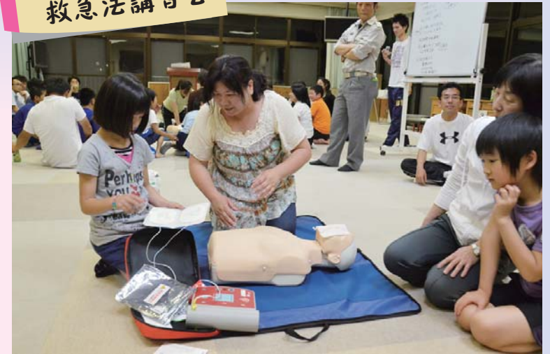
親子で参加したよ！