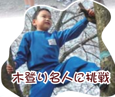
木登り名人に挑戦