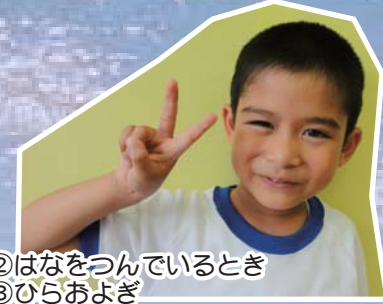
②はなをつんでいるとき ③ひらおよぎ ④サッカーせんしゅ