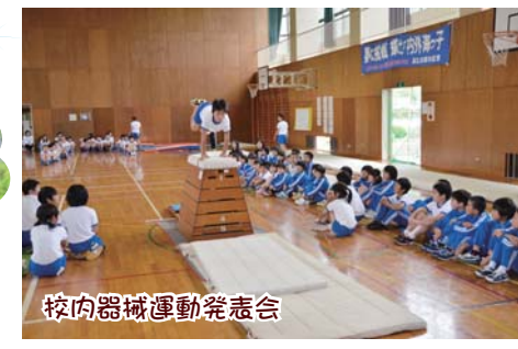
校内器械運動発表会