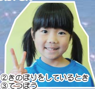
②きのほりをしているとき ③てつぼう ④ケーキやさん