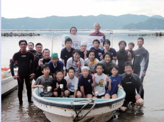
地域の皆さんに守られて 800M 完泳