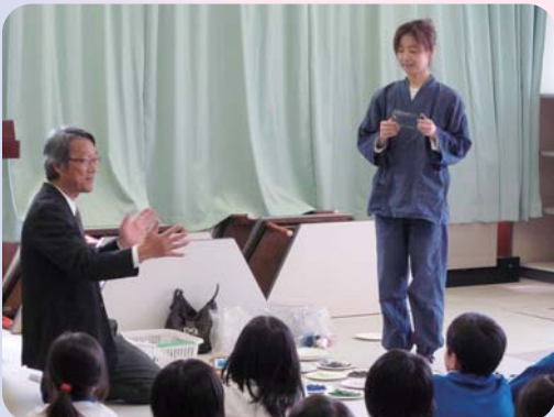
海夢トンネルのスタンドグラスを作る計画