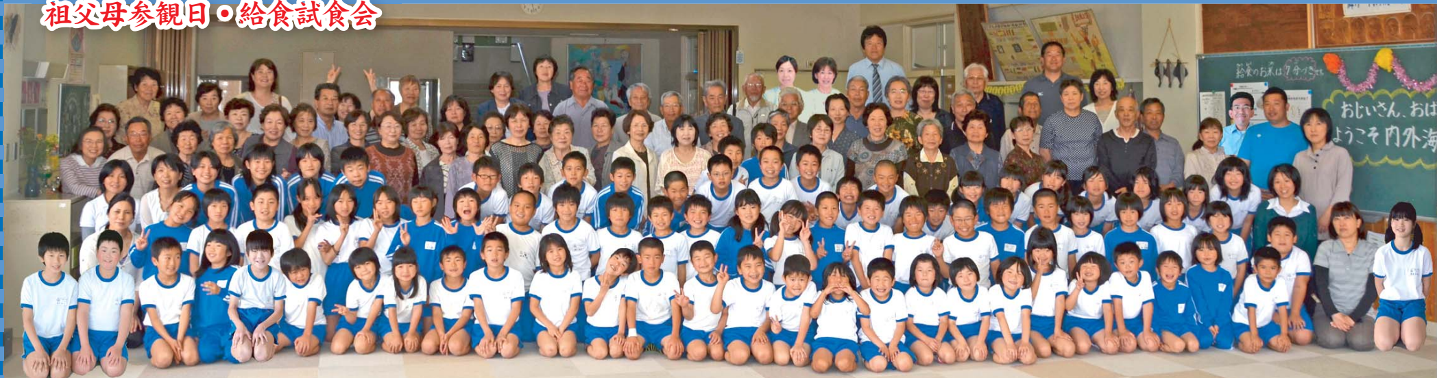
たくさん集まってくれました。大家族です。