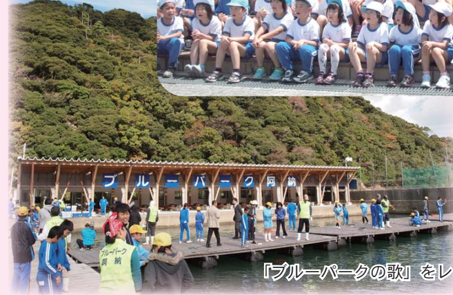
「ブルーパークの歌」をレコーディング