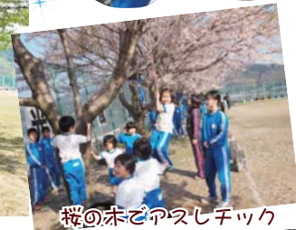
桜の木でアスレチック