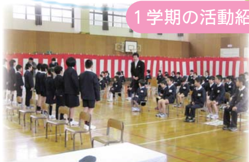
歓迎式 新しい仲間を迎えて元気な出発