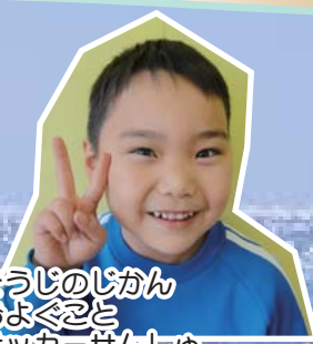
②そうじのじかん ③およぐこと ④サッカーせんしゅ