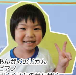
②あながくのじかん ③ピアノ ④ほいくえんのせんせい