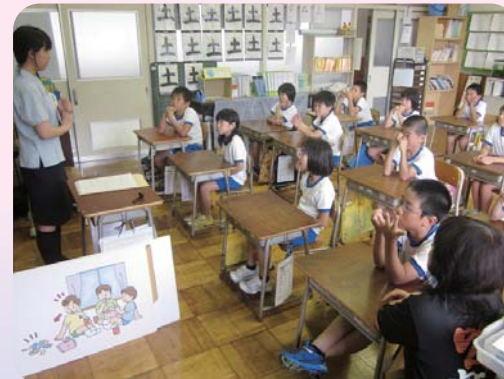
ひまわり教室 (防犯)