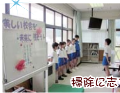
掃除に志を入れて