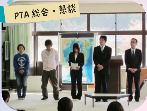
役員挨拶 活動計画