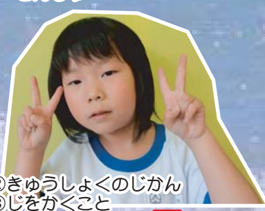
②きゅうしょくのじかん ③じをかぐこと ④かしゅ