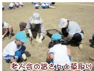
老人会の皆さんと草取り