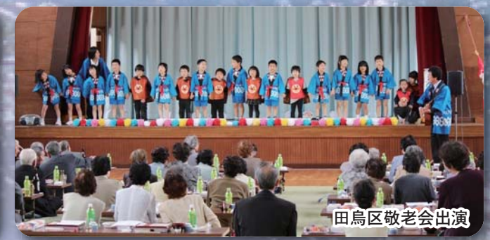
田鳥区敬老会出演