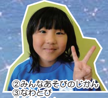
②みんなあそびのじかん ③なわとび ④お花やさん