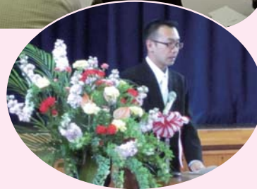
入学式で領家会長が祝辞