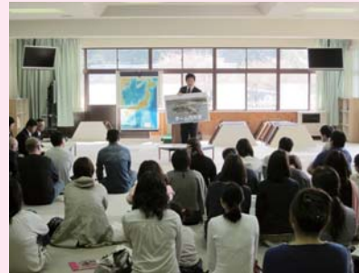
チーム内外海で子どもたちを育てよう