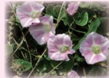
ハマヒルガオが咲く