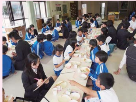
小浜水産高校生が給食を見学