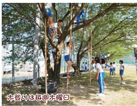
木登りは毎週木曜日