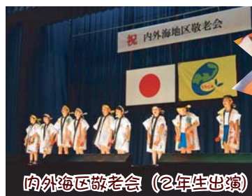
内外海区敬老会 (2年生出演)