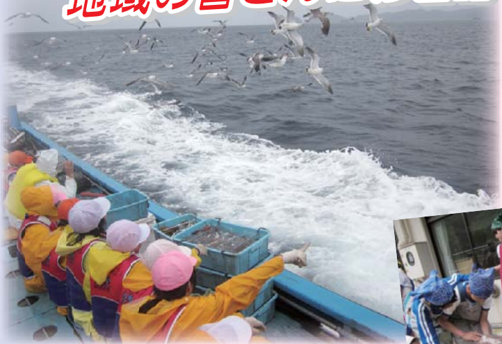
宇久定置で漁業体験～帰りの船でカモメと遊ぶ