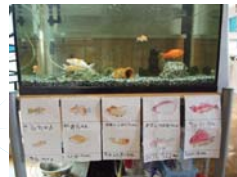
金魚に名前がついたよ