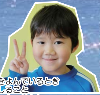
②本をよんでいるとき ③はしるごと ④サッカーせんしゅ