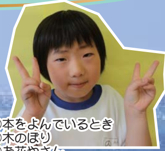
②本をよんでいるとき ③木のほり ④お花やさん