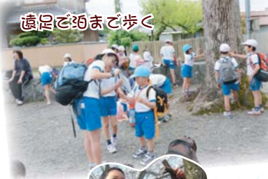
遠足と泊まで歩く