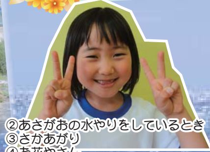
②あさがおの水やりをしているとき ③さかあがり ④お花やさん