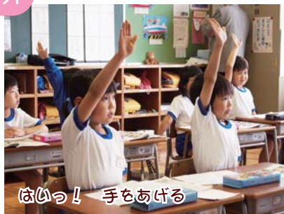
はいっ!! 手をあげる