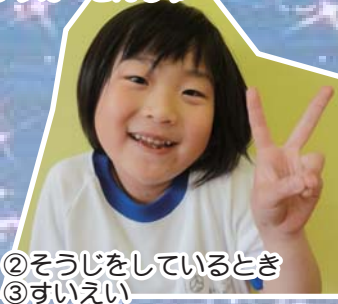
②そうじをしているとき ③すいらい ④パンやさん