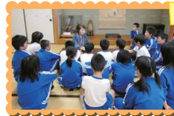
読み聞かせボランティアのみなさん